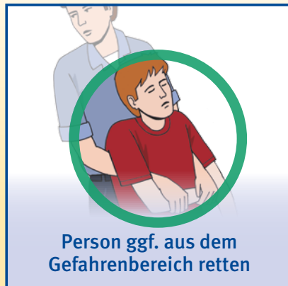
Person ggf. aus dem Gefahrenbereich retten