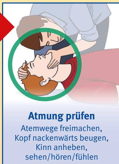
Atmung prüfen Atemwege freimachen, Kopf nackenwärts beugen, Kinn anheben, sehen/hören/fühlen