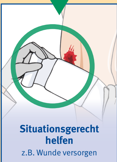
Situationsgerecht helfen z.B. Wunde versorgen