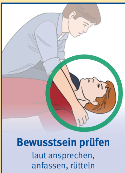
Bewusstsein prüfen laut ansprechen, anfassen, rütteln